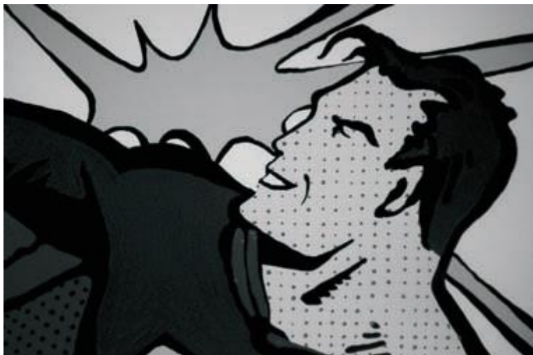
Figura 2: Roy Liechtenstein. Super-Homem, 1964. Serigrafia. (Disponível em: < http://icclebexart.webs.com/ >. Acesso em: maio 2015.)

O Super-Homem ganha poderes pelos efeitos dos raios solares, mas tem uma fraqueza: o minério criptonita. O Homem-Aranha adquire habilidades depois da picada de um aracnídeo. O Quarteto Fantástico nasce dos efeitos de uma tempestade cósmica. Um a um, os elementos da natureza tornam-se importantes para o nascimento de vários super-heróis. Porém, mais do que superpoderosos, esses heróis de Histórias em Quadrinhos (HQ) também “escondem um segredo”: